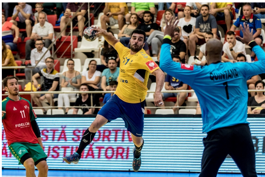
Fotografie de acțiune