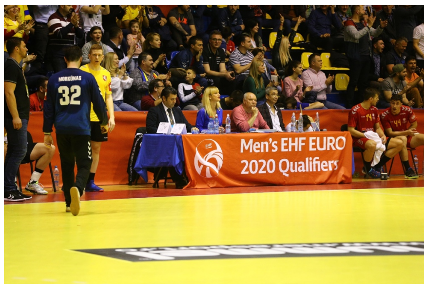
Fotografie banner masa oficială