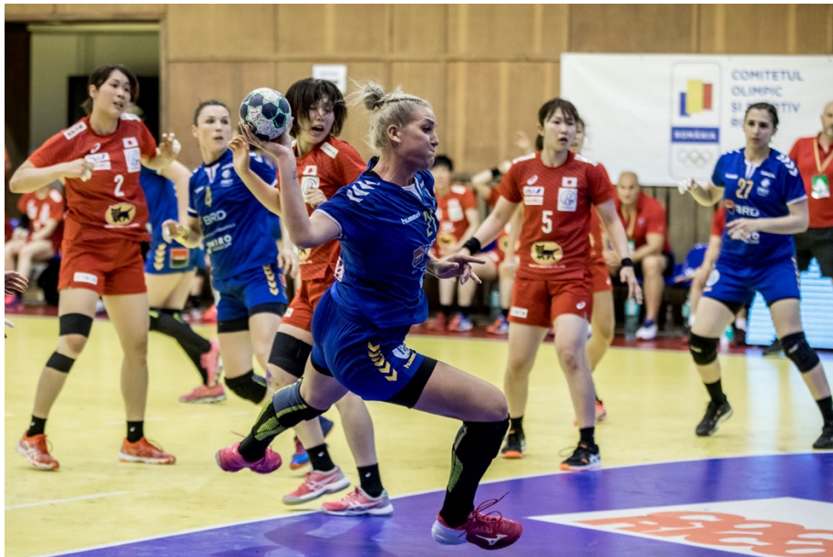
Fotografie de acțiune