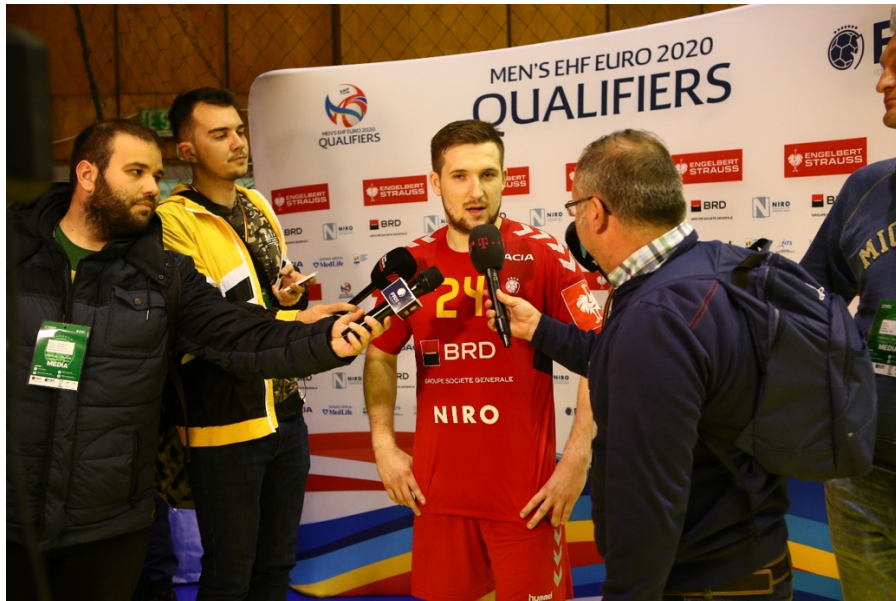
Fotografie panou interviuri